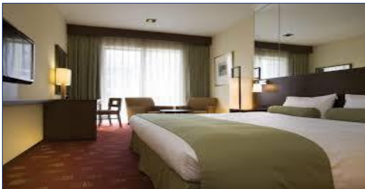
京都新都酒店图片